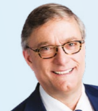
De burgemeester Vincent DE WOLF

Wij hopen dat u uw gading zult vinden en wij zien u graag op 7 oktober 2022 om samen het glas te heffen.