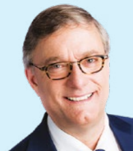
Votre bourgmestre Vincent DE WOLF

Nous espérons que vous trouverez votre bonheur dans cette nouvelle programmation, et nous vous donnons rendez-vous le 7 octobre 2022 pour le verre de l'amitié.