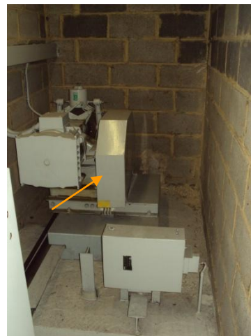
Photo 2 4 ème étage, machinerie