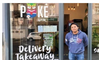
10. Snackbar "Poké bar"