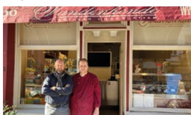
13. Chocoladewinkel "Vandenhende"