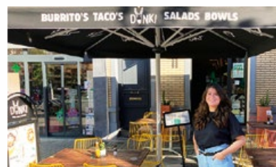
3. Restaurant "Donki Jourdan"