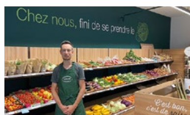
14. Voedingswinkel "Séquoia Jourdan"