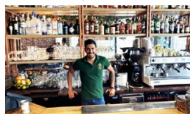
7. Bar "Kosmos"