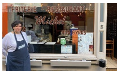
5. Restaurant "Michel"