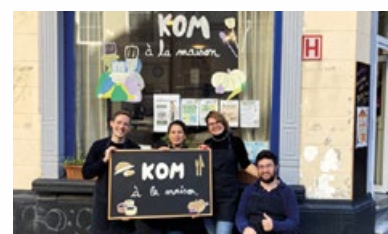
8. Solidair restaurant "KOM à la maison"