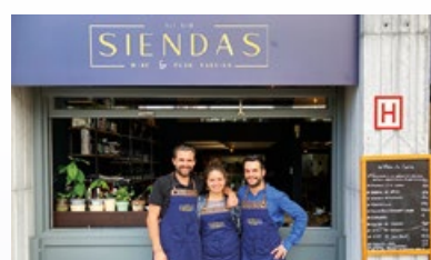
15. Restaurant "Siendas"