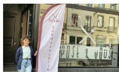
11. Snackbar "Pose&amp;Vous"