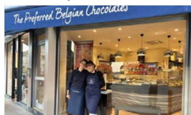
6. Chocoladewinkel "Léonidas La Chasse"