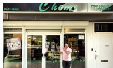
2. Banketbakkerij "Chems"