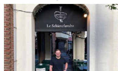
16. Restaurant "Le Schievelavabo"

Het is onmogelijk voor een gemeente om de netheid in de straten alleen te garanderen. Het is dus een grote maatschappelijke uitdaging die de hele bevolking aanbelangt. De gemeente Etterbeek is zich ervan bewust dat het geven van het goede voorbeeld een van de beste manieren is om mensen ertoe aan te zetten hun straten schoon en dus aangenamer te houden.