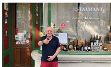
1. Restaurant "Au Cor de Chasse"

Enkele maanden geleden heeft de gemeente het label "Geëngageerde handelszaak voor de netheid" gelanceerd. Dat label wordt uitgereikt aan horecazaken en handelszaken die voeding verkopen en wil hen aanmoedigen om zich op een duurzame manier in te zetten voor de netheid in hun handelsruimte. Maak kennis met de eerste zestien zaken die het label hebben behaald.