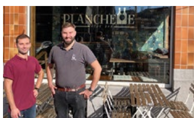
9. Wijnbar "Planchette"