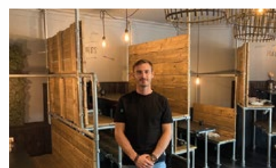
12. Restaurant "Poule&amp;poulette Jourdan"