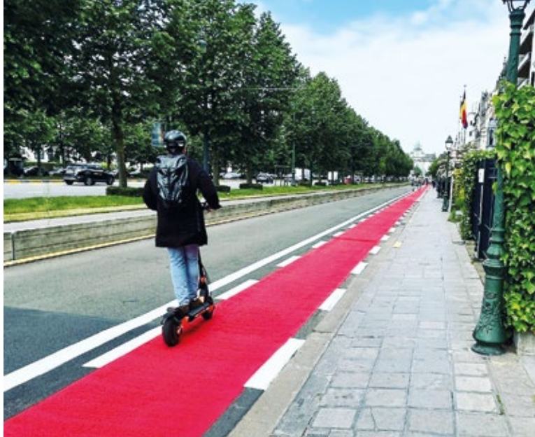
Net als op de Tervurenlaan wordt er een nieuw fietspad aangelegd op de Tweede Lanciers Regimentlaan en de Kazernenlaan.

H et mooie weer is terug en er zijn volop mogelijkheden om de fiets te nemen voor korte of lange verplaatsingen.