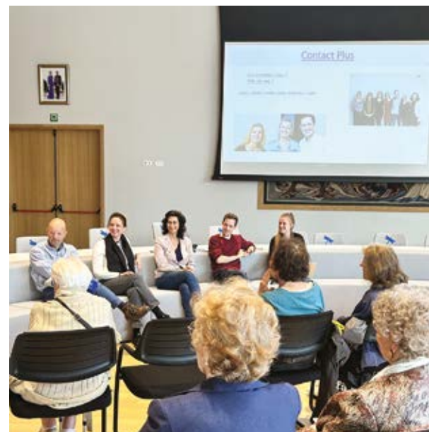
De senioren konden de voorstelling van de dienst Contact Plus bijwonen.