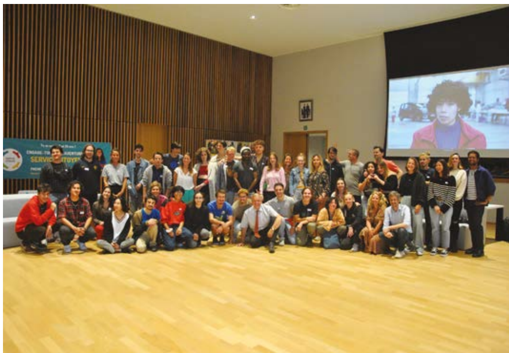
Op 10 oktober 2023 woonden heel wat jongeren uit de gemeente een infoavond over de Samenlevingsdienst bij.

N.B. : Ik kom aan bij Le Senghor in de vroege namiddag. Ik begroet mijn collega's en werk tot 15 uur aan minder praktische taken (computer, communicatie, enz.). Dit houdt in dat ik met mijn collega's overleg over hoe het verder moet, tijdens teamoverleg of vergaderingen onderling. Bij Le Senghor werk je altijd als team, er is een goede communicatie tussen ons. Om 15.30 uur begint de huiswerkschool. Ik ben dan begeleider tot 17.30 uur. Ik help leerlingen van de lagere school met hun huiswerk. Als ze geen huiswerk hebben, maken we een praatje of ze houden zich bezig. Wanneer de kinderen klaar zijn met hun huiswerk, doen ze workshops met de andere medewerkers van de huiswerkschool. Ik wandel dan uit nieuwsgierigheid langs de verschillende workshops. Mijn dag eindigt rond 18 uur als alles is op-