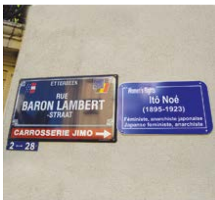
Sporen van het koloniale verleden zullen uitleg en context krijgen.

Laat ons eerst even teruggaan naar de oorsprong van deze commissie. In mei 2020 bracht de moord op Gerge Floyd door een politieagent in Minneapolis een schokgolf teweeg en verspreidde de "Black Lives Matter"-beweging zich over de hele wereld. In juni kwamen meer dan 10.000 mensen betogen in Brussel. De strijd tegen racisme staat centraal in het debat en, bij uitbreiding, de kwestie van de koloniale herinnering.