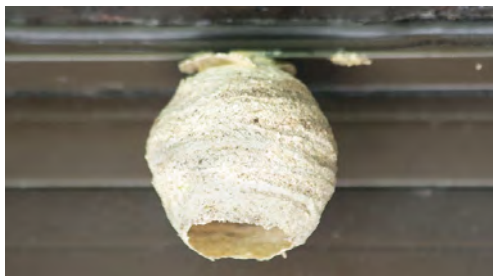
Primair nest of voorjaarsnest

Aan het einde van de winter verlaten de koninginnen hun schuilplaatsen en maken vanaf april een eerste nest waarin ze hun eerste eitjes leggen. Deze nesten zijn klein en rond van vorm, hebben een opening aan de basis en zijn over het algemeen beschermd tegen weersinvloeden (zolder, dakgoot, enz.). In mei bouwen de werksters een tweede nest waaruit de rest van de kolonie wordt geboren. Dit tweede traanvormige nest is imposant. Het kan tot 80 cm groot zijn en tot 2000 individuen bevatten. Het heeft