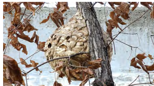
Secundair nest of zomernest

Half september komen de voortplantende dieren tevoorschijn en vinden er bevruchtelingen plaats tot het begin van de winter, wanneer de mannetjes en werksters sterven en de koninginnen het nest verlaten om beschutting te zoeken.