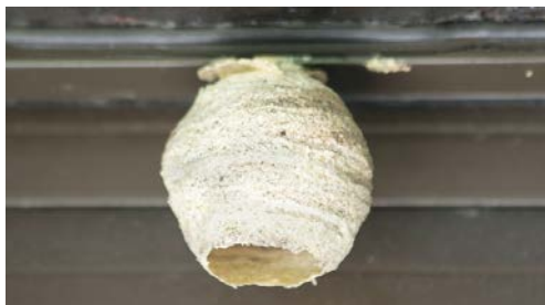
Nid primaire ou « de printemps »

Au sortir de l'hiver, les fondatrices sortent de leur abri et créent dès avril un nid primaire où elles pondront leurs premiers œufs. De taille modeste et de forme arrondie, ces nids ont une ouverture à la base et sont généralement situés à l'abri des intempéries (grenier, corniche, etc.). En mai, les ouvrières érigent un nid secondaire au sein duquel naîtra le reste de la colonie. Plus imposant – il peut atteindre 80 cm et contenir jusqu'à 2.000 individus –, ce deuxième nid en forme de goutte, duquel il est vivement déconseillé de s'approcher, est le