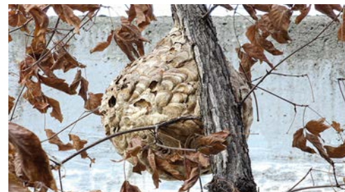
Nid secondaire ou « d'été »

À la mi-septembre, les reproducteurs émergent et les fécondations ont lieu jusqu'au début de l'hiver, moment où mâles et ouvrières meurent et où les fondatrices abandonnent le nid pour se mettre à l'abri.