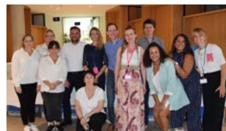
Les membres du service Contact Plus et le staff de l'Economat lors du Thé dansant des seniors organisé le 21 septembre

Contact Plus est pour rappel le guichet unique de la commune pour tout ce qui a trait aux personnes âgées et/ou en situation de handicap. Celles-ci peuvent y faire appel pour toute une série de services : aide sociale, accompagnement dans les démarches administratives ou le maintien à domicile, petits travaux de réparation ou de rénovation en collaboration avec la Mission locale, transports non-urgents pour les consultations médicales, les loisirs, le volontariat, etc.