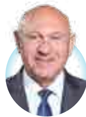
Aziz Es Schepen van Economische en Commerciële Ontwikkeling