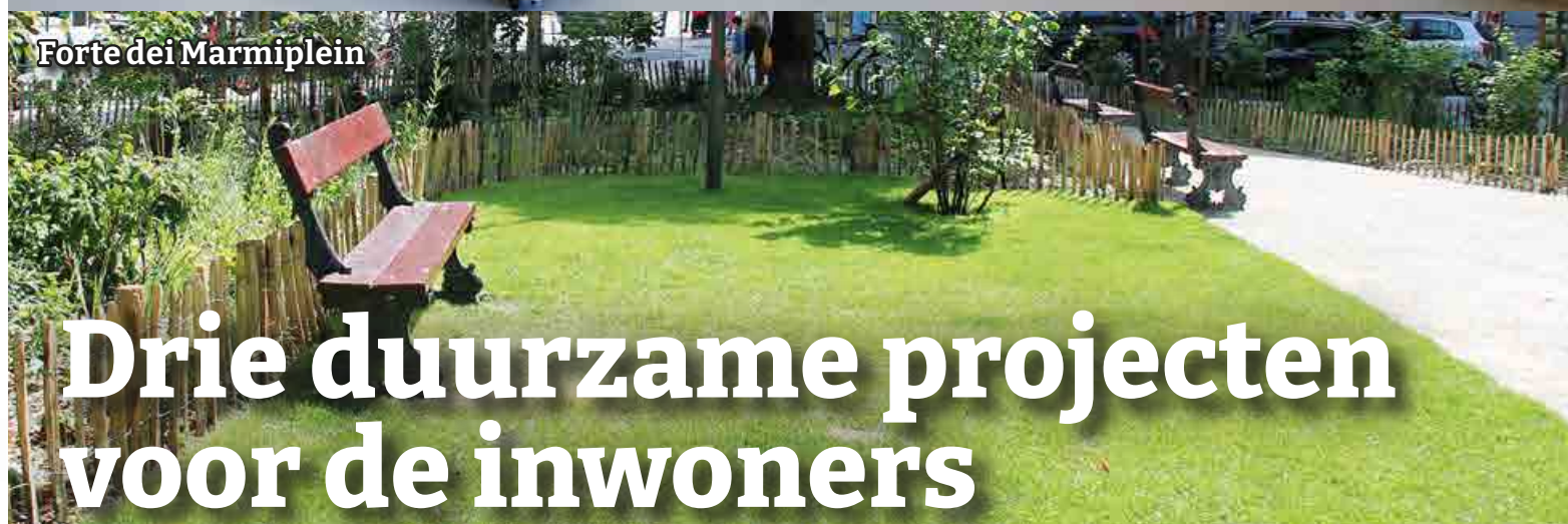
Forte dei Marmiplein

Drie duurzame projecten voor de inwoners