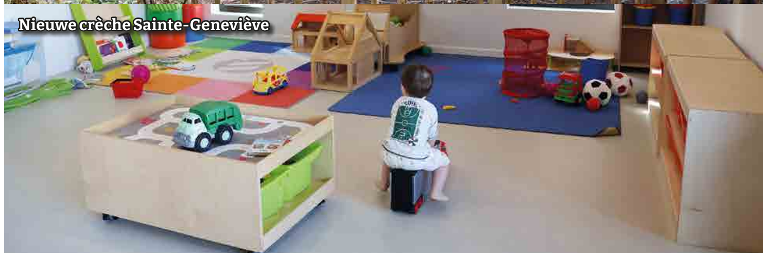
Nieuwe crèche Sainte-Geneviève