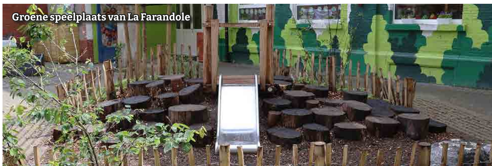
Groene speelplaats van La Farandole